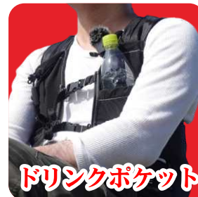
ドリンクポケット