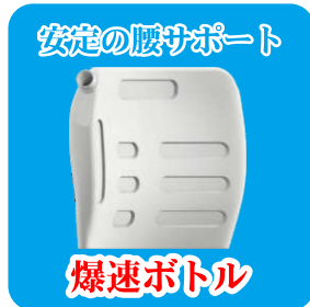
安定の腰サポート