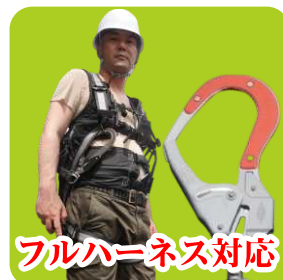
フルハーネス対応